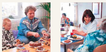
Bilder aus der ersten Broschüre der Station für Palliative Therapie

Wir sind deshalb besonders stolz, dass die Eröffnung einer Station für Palliative Therapie am Salem-Spital Realität wird. Heute wird die Station eröffnet. Aber damit sind wir noch lange nicht am Ende unserer Arbeit. Unsere Aufgabe wird sein, Erfahrungen zu sammeln. Wir hoffen auf eine enge Zusammenarbeit, konstruktive Kritik und persönliches Engagement aller Beteiligten, damit die Station nicht zu einer «symptomatologischen» Station degeneriert, sondern zu einer «totalen aktiven Therapie- und Pflegestation» wird.