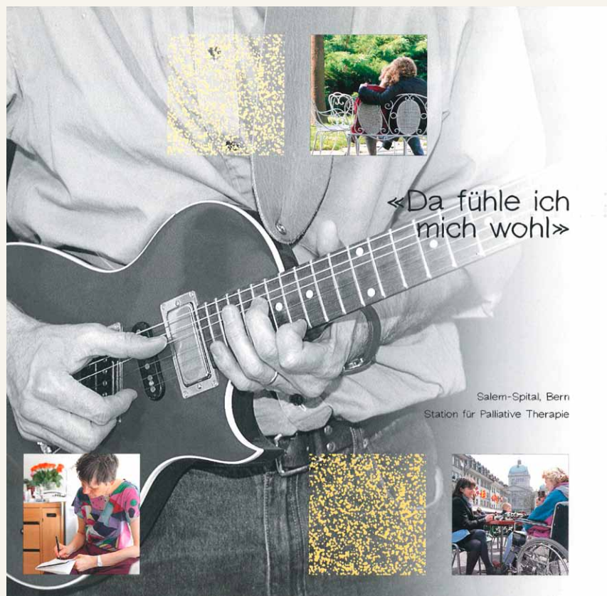
Salem-Spital, Bern Station für Palliative Therapie

Mancher wird sich fragen, warum das alles. Ich kann doch meinen Patienten auf einer normalen Abteilung betreuen. Das mag gestimmt haben. Es ist deshalb nicht erstaunlich, dass die neue Fachrichtung für Palliative Therapie in den letzten Jahren dermassen an Bedeutung zugenommen hat, waren es noch vor 30 Jahren 16 Prozent der Patienten, die an einem Tumorleiden starben. Jetzt sind es bereits 25 Prozent, und diese Zahl nimmt ständig zu. Trotzdem sind Palliativ-Stationen immer noch dünn gesät. Nur in England gibt es einen anerkannten Titel für Palliative Therapie mit einem Lehrstuhl und einer damit verbundenen Fortbildung.